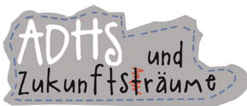
Logo der Kampagne „ADHS und Zukunftsträume“