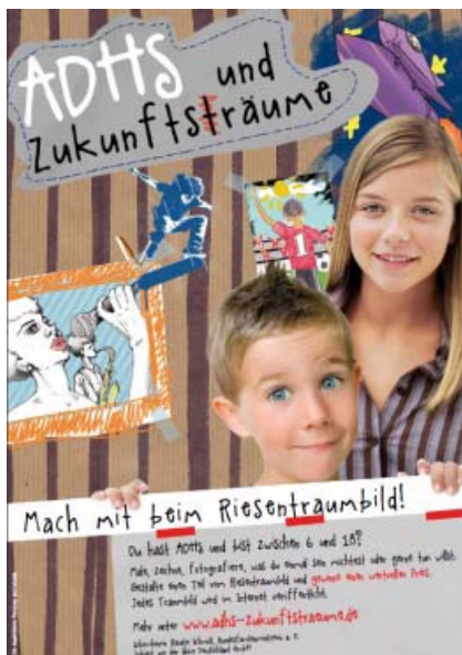
Plakat der Kampagne „ADHS und Zukunftsträume“