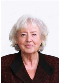
Renate Schmidt Bundesfamilienministerin a. D. Schirmherrin der Kampagne